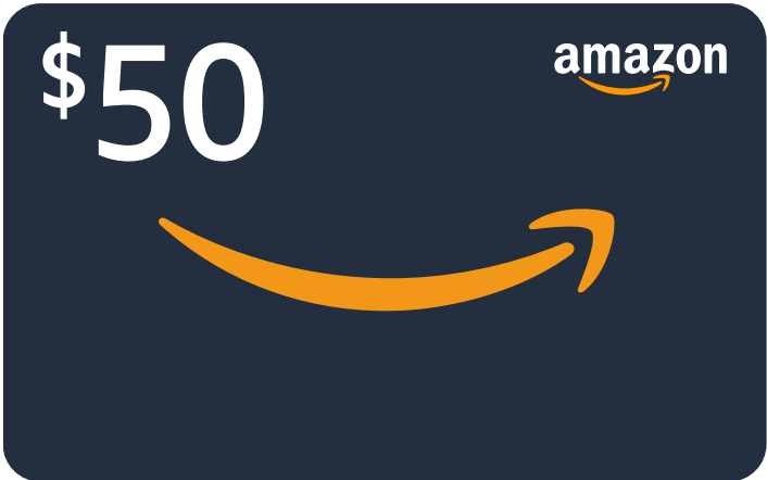
✗ No cambie la escala ni ubicación de la denominación.