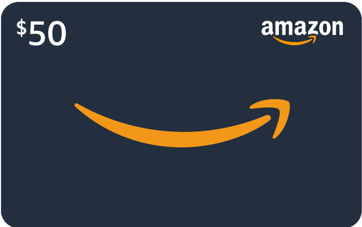
✓ Tarjeta de Regalo de denominación fija Amazon proporcionará ilustraciones para todas las denominaciones fijas requeridas.