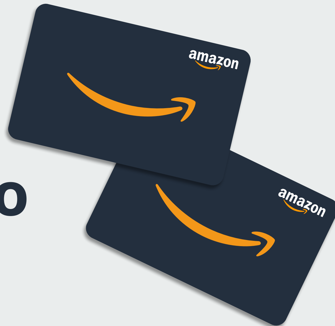
Imagen de Tarjeta de Regalo de Amazon: Pautas de uso