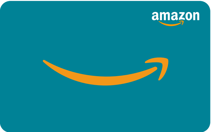
✗ No vuelva a colorear la obra de arte.